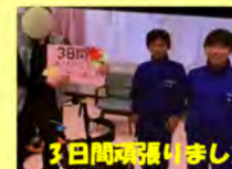
3日間頑張りました