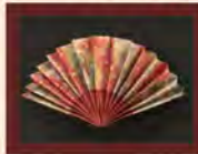
扇を折って、60×40 cmの大作に仕上げました!