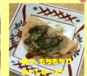
餃々、もちもちでおいしかった~