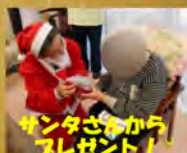
サンタさまからプレゼント!