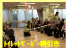
トランプゲーム・綱引き

11月、洛西中学と西京高校附属中学から計5名の生徒さんが、福祉体験のためデイにやってきました。この日に合わせて開催した運動会では、最大82才(!)の年齢差も越えて、一致団結!頑張りました