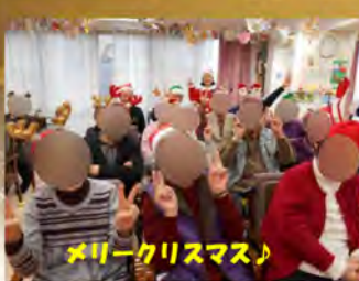
メリークリスマス!