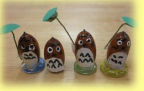
葉っぱの傘を差してます